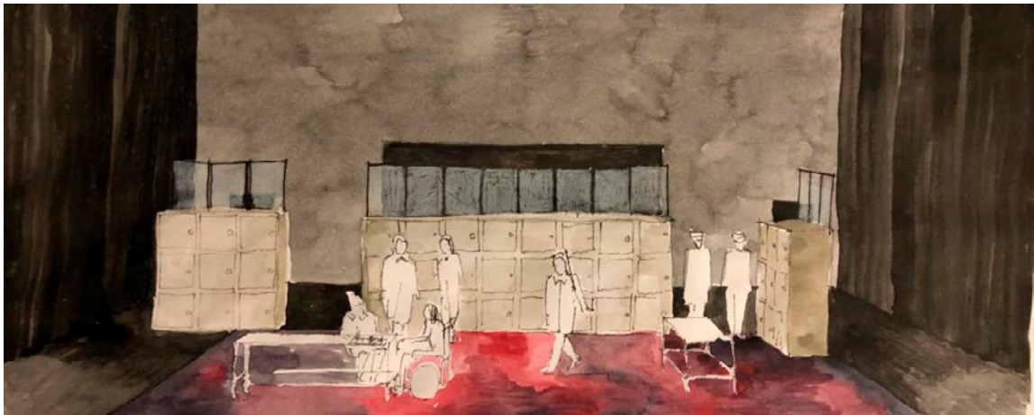
Dessins d'études pour la scénographie - Irène Vignaud